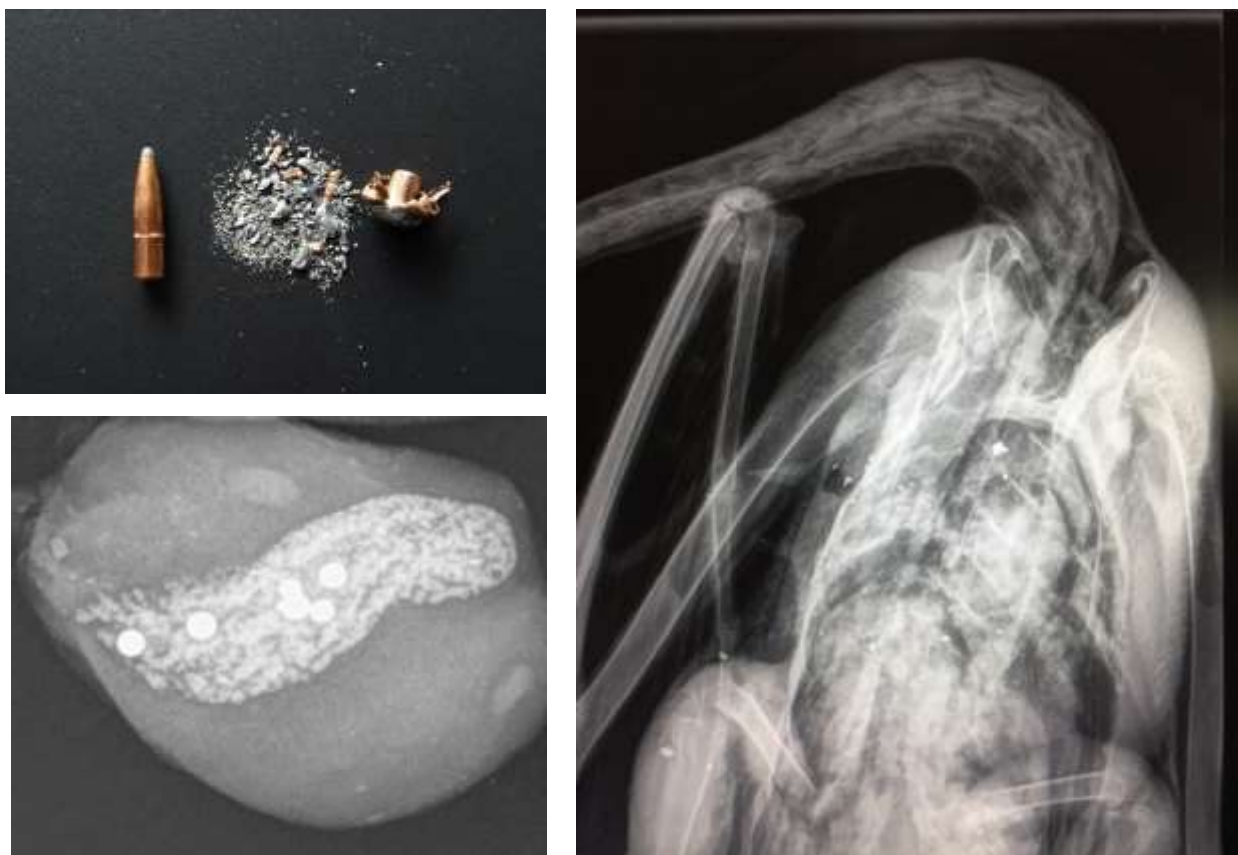
Figur 1. Øverst til venstre: Riffelprojektiler af bly splintres ved gennemtrængning af byttet. Hermed frigives en stor mængde blyfragmenter med risiko for forgiftning af ådselædere og andre konsumenter. Billedet viser et almindeligt blyprojektil før og efter træf. Til højre: Fordeling af projektilfragmenter i knopsvane skudt med blyriffelammunition. Nederst til venstre: Fasankråse med 6 ædte hagl, heraf 4 stål- og 2 blyhagl.

Når blyhagl indskydes i kroppen på et dyr, afsættes der et spor af mikroskopiske stumper metal i kød, bindevæv, organer, blod og knogler. Hagl kan være indlejret i dyr, der efterlades i naturen (anskudt og mistet vildt) og kan hermed optages af ådselædere. Det samme kan være tilfældet, hvor fugle (typisk vandfugle, men også terrestriske arter) via føde eller kråseflint æder blyhagl, som er spredt via jagt (Figur 1). Klassiske riffelprojektiler af bly er konstrueret til at gå i stykker under passagen af vildtkroppen for at øge dræbeevnen (Figur 1).