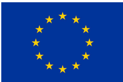
European Union European Maritime and Fisheries Fund

Udsætningen af ål finansieres af Den Europæiske Hav- og Fiskerifond og Fiskeristyrelsen samt Fiskeplejemidler.