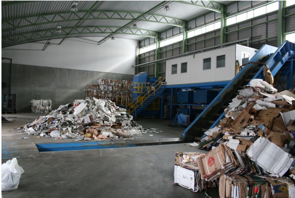
Figur 6.1 Interkommunali Renovatiónsfelagsskapurin (IRF)s omlastningsstation for papir, pap og plastik i Leirvik. Sorteringsanlægget ses til højre i billedet.