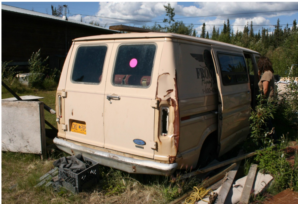
Figur 6.2 Varevogn i Tanana markeret med "Pink dot", der angiver at emnet kan fjernes med ejerens billigelse og videresælges til genanvendelsesindustrien.