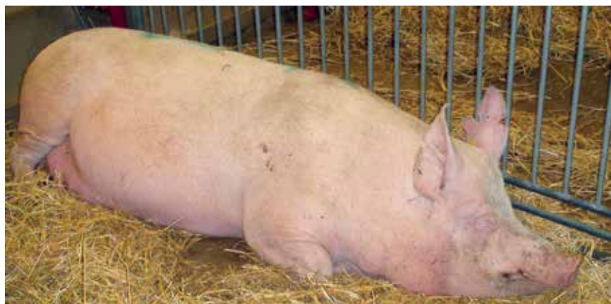
Drægtig so inficeret med ASFV PID4.

Resultater fra dette forsøg er publiceret i DVT, 12, 2013.