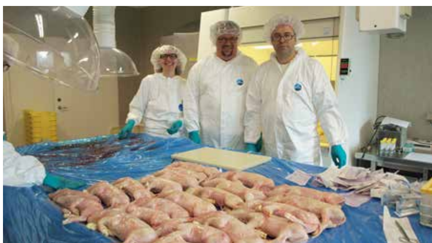
Fødevarerstyrelsens dyrlæger på besøg på sektionstuen på Lindholm.