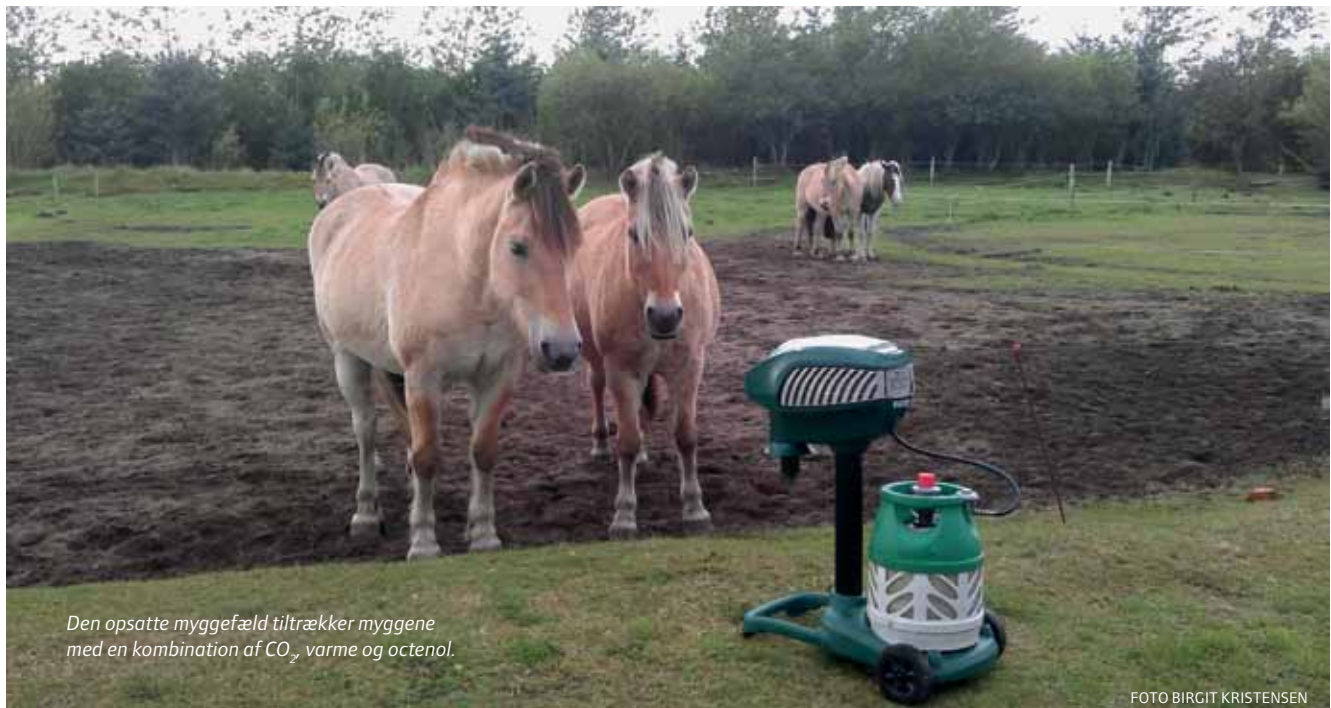
Den opsatte myggefæld tiltrækker myggene med en kombination af CO 2 , varme og octenol.