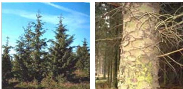
Figur 1 Sitkagran blev indført til Europa fra Nordamerika i 1830'erne, og træet kom til Danmark omkring 1850. I Danmark er den plantet i stor udstrækning, især i nord- og vestjyske klitplantager, i kystnære skove, på blødbundsarealer og på stærkt vindeksponerede lokaliteter. Den findes på omkring 34.000 ha, hvilket svarer til knap 7 % af det samlede skovareal (Skov- og naturstyrelsen).

I vest er plantagen præget af det barske klima og den sandede jordbund, mens man får et helt anderledes indtryk i plantagens østlige del, hvor der er mere løvskov. Her ligger kun et tyndt sandlag over den frodige jordbund. Længst mod øst grænser plantagen op til Tømmerby fjord, som hører til naturreservatet Vejlerne. I Østerild Klitplantage findes både de store vidder og den stille idyl. Plantagen er karakteriseret ved sin store variation, men også ved de mange tilbud til skovgæsten.