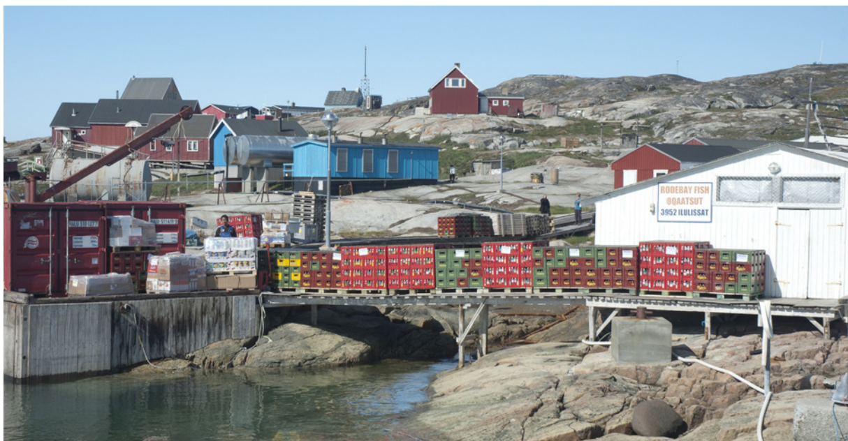
Bygden Rodebay nord for Ilulissat.

For langt størstedelen af bygderne er eksistensgrundlaget fiskeri kombineret med fangst. Ofte indgår fangsten ikke, eller kun i begrænset omfang, i bygdens registrerbare økonomi. Men fangsten bidrager i væsentlig grad til det lokale fødegrundlag, og specielt i de mindre bygder opretholdes de gamle traditioner med kødgaver til alle der ikke selv har mulighed for at gå på fangst hvor fangst i de større bygder primært distribueres inden for familiestrukturerne. Samtidig bidrager fangsten til den enkelte fangerfamilie samlede indkomst enten gennem bytte med anden fangst, bær eller tilsvarende fra andre distrikter, eller den sælges af uformelle kanaler over det meste af landet. Dermed udgør en stor del af fangsten og en del af fiskeriet den ikke registreret subsistensøkonomi.