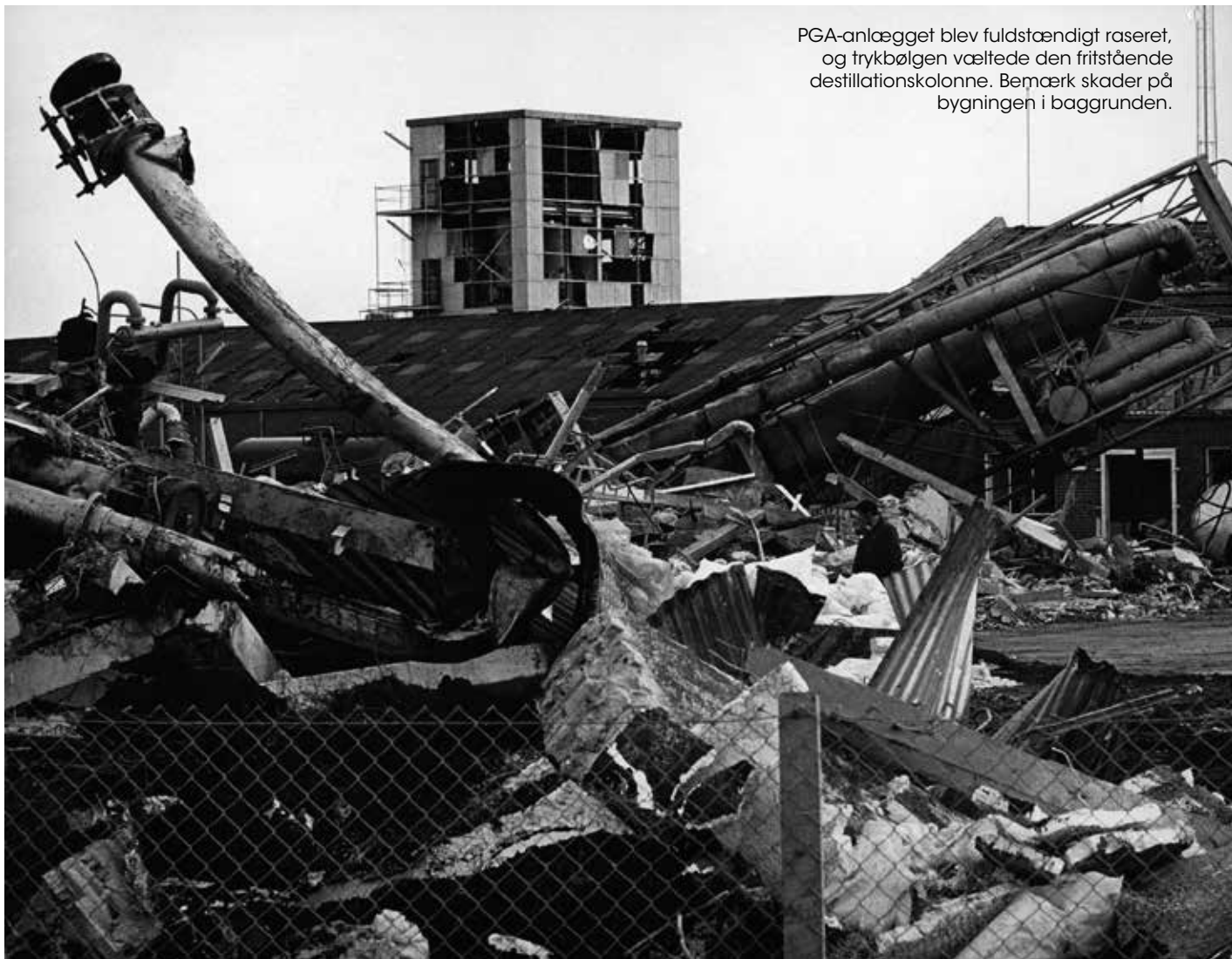
PGA-anlægget blev fuldstændigt raseret, og trykbølgen væltede den fristående destillationskolonne. Bemærk skader på bygningen i baggrunden.