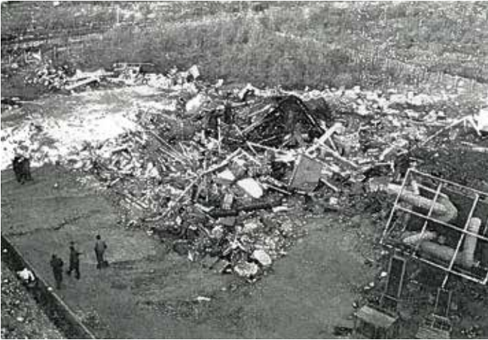
Anlægget blev fuldstændig jævnet med jorden, ydervæggene stod knapt tilbage. Kilde: [3].

bygningen formentlig for at nå frem til styretavlen i det ikke-gnistssikrede rum på førstesalen for at afbryde strømforsyningen. Driftsingeniøren var på vej over gårdspladsen mod anlægget. De to unge stod udenfor. Dampene var formentlig trængt ind i rummet med styretavlen. Alle fire blev dræbt ved eksplosionen. Der ville sandsynligvis have været (mange) flere dræbte, hvis ikke det store daghold netop lige havde forladt Grindstedværket.