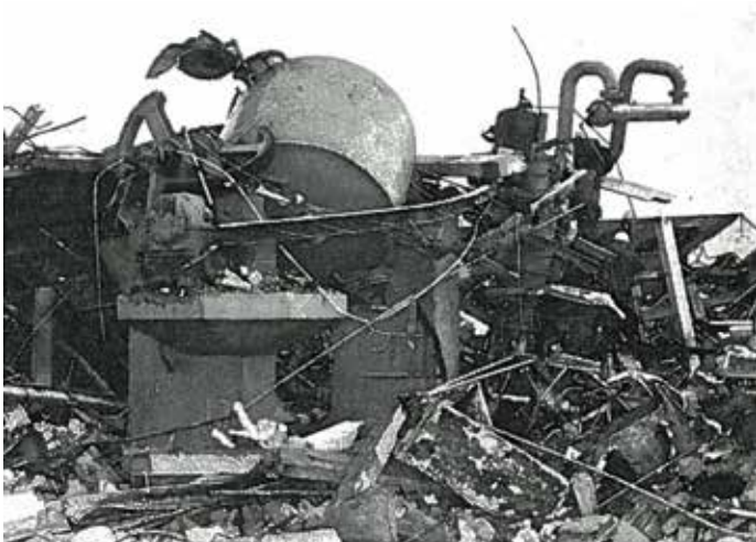
Intet var uskadt i den eksplosionsramte bygning. Kilde: [3].

den gamle måde at gøre tingene på med zone-klassificering, anvendelse af Ex-godkendt udstyr, sikring mod statisk elektricitet og andre tændkilder; og 3. Træffe forholdsregler til afhjælpning af virkningen af en eksplosion, af hensyn til de ansattes sikkerhed.