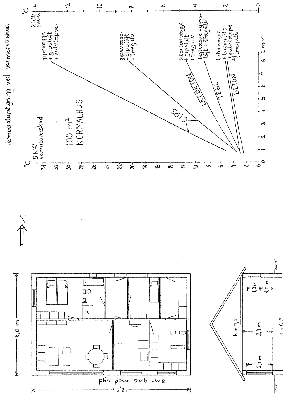
Fig. 3. Varmeakkumulering i indvendige bygningskonstruktioner. Et "normalt" enfamiliehus på 100 m 2 med BR-77-isolering har ved minimering af vinduesarealet mod nord kunnet få 8 m 2 glas mod syd. For forskellige valg af materiale til bagmure, skillevægge, loft og gulv er vist rumlufttemperaturstigninger ved dels 5 kW og dels 2 kW varmeoverskud (eller temperaturfald ved varmeunderskud), (ref. 5).