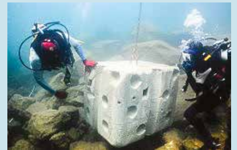
Andre steder placerer man kunstige rev lavet af beton i havneområder. Det kunstige rev har en speciel overfladestruktur, der betyder, at det hurtigt koloniseres af mange forskellige organismer.