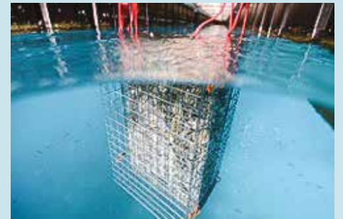
En biohut giver fisk bedre mulighed for at søge skjul og føde.

I udlandet har man udviklet metoder til at understøtte fisk og biodiversitet i havneområder. Man har bl.a. udviklet en "biohut", der kan sænkes ned i vandet og hænge i havnen i en årrække. Biohut'en består af et gitter af metal og rummer en masse østerskaller, som giver bedre muligheder for skjul og fødesøgning hos småfisk. De mange småfisk giver et forbedret fødegrundlag for de større fisk.