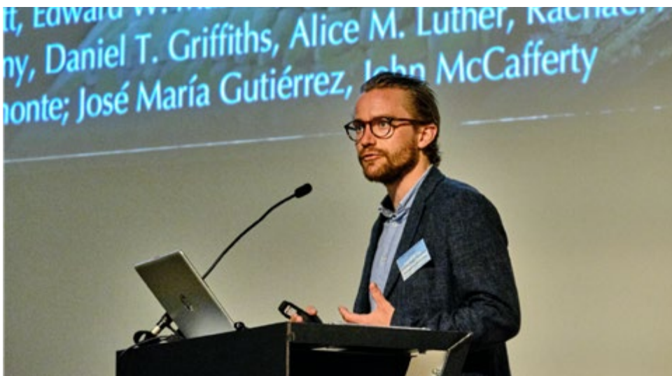
Livet som forskningsgrupeleder, hvor jeg første gang præsenterer, hvordan man kan lave en cocktail af menneskelige antistoffer mod den sorte mambas farligste toksiner.