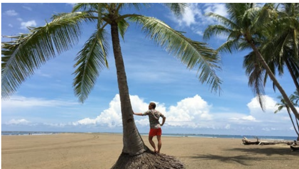
Det hårde liv som giftforsker i Costa Rica.