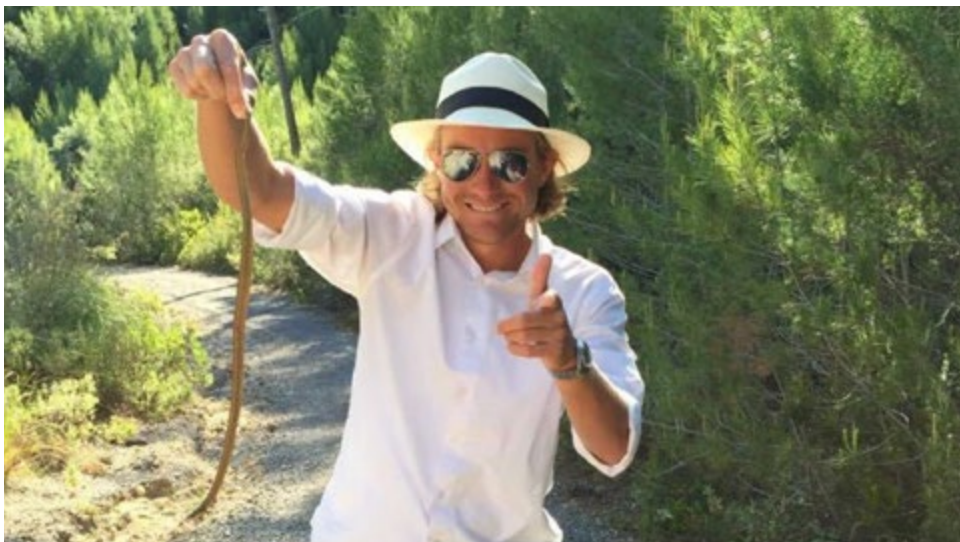
Hvordan man imponerer kandidatstuderende.