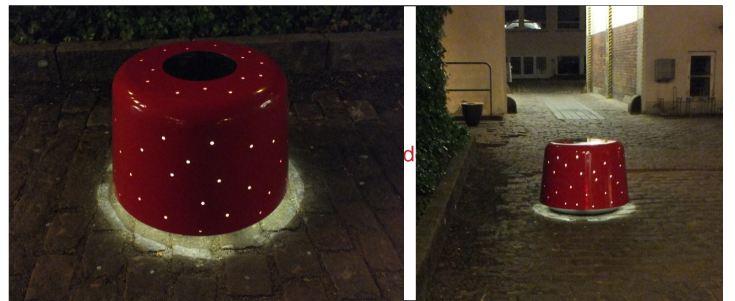
Prototyper af DOT pullerten (Forhandles af out-sider – designet af Nils Grønnet-Jensen)