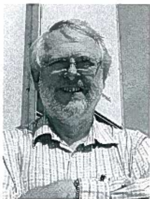
Center for Facilities Management – Realdania Forskning Danmark Tekniske Universitet www.cfm.dtu.dk