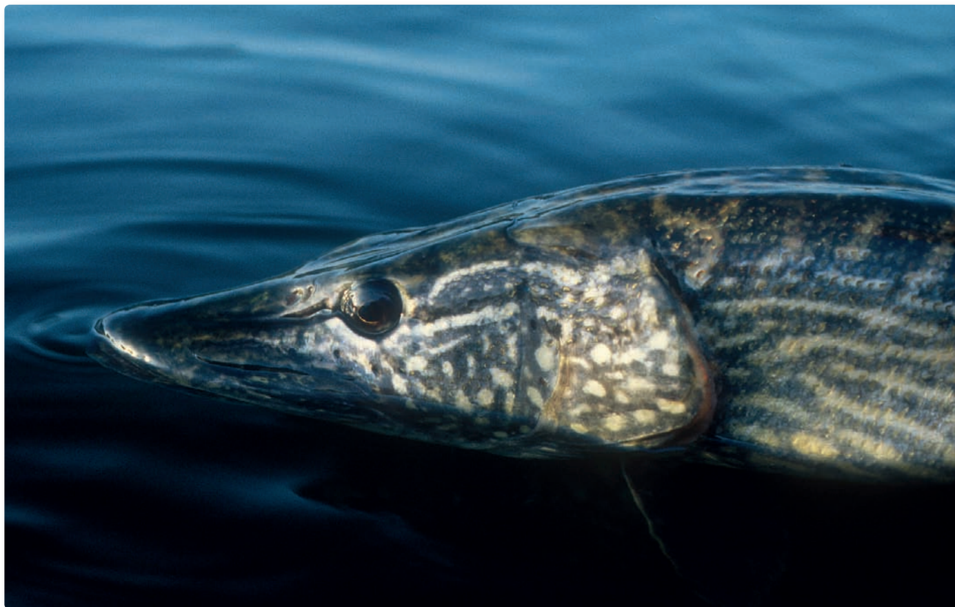
Fredningstiden kan med fordel udvides 14 dage i begge ender.

Sådanne lokale fænomener kan man imødegå ved at aftale lokale fredningstider. Ønsker man i den forbindelse maksimal sikkerhed for altid at dække den reelle gydeperiode er anbefalingen at indføre en generel fredning fra 15. marts til 15. maj. ☞