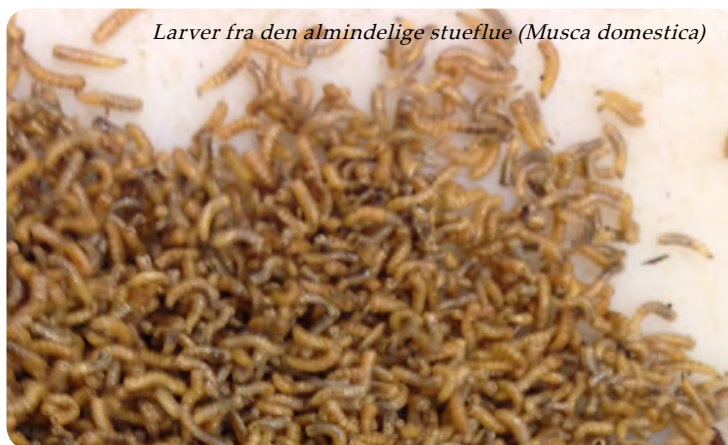
Larver fra den almindelige stueflue ( Musca domestica )

Selvom fluens larvestadium foregår i rådrende organisk materiale eller gødning fra dyr og mennesker, tyder ny forskning på at larvens omsætning af gødningen er en vigtig og aktiv medspiller i elimineringen af uønskede bakterier som fx. Campylobacter jejuni .