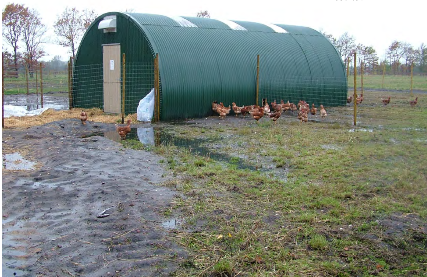
Hønsene i Organic RDD projektet Bioconval, som får tilskud i form af fluelarver.

Organic RDD under GUDP er finansieret af Ministeriet for Fødevarer, Landbrug og Fiskeri og koordineret af ICROFS.