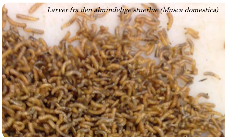
Larver fra den almindelige stueflue ( Musca domestica )

Selvom fluens larvestadium foregår i rådrende organisk materiale eller gødning fra dyr og mennesker, tyder ny forskning på at larvens omsætning af gødningen er en vigtig og aktiv medspiller i elimineringen af uønskede bakterier som fx. Campylobacter jejuni .